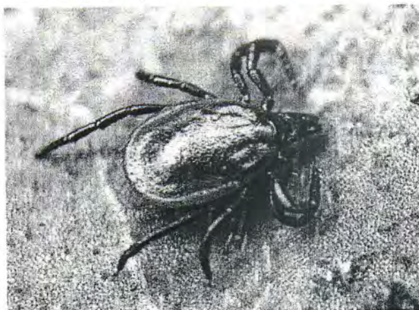
Таежный клещ рода Ixodes

Спектр инфекций, передающихся от клеща человеку, довольно широк и включает в себя клещевой энцефалит (КЭ), иксодовые клещевые боррелиозы (ИКБ) или болезнь Лайма, моноцитарный эрлихиоз человека (МЭЧ), гранулоцитарный анаплазмоз человека (ГАЧ), туляремия и др.